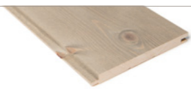
GLATTPANEL | SETERGRÅ Furu / 14x95/120/145 mm Strukturbørstet og beiset