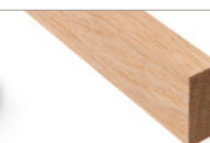
GLATTKANT Eik ubehandlet 20x45 mm