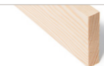
GLATTKANT Furu ubehandlet Fås i mange dim.