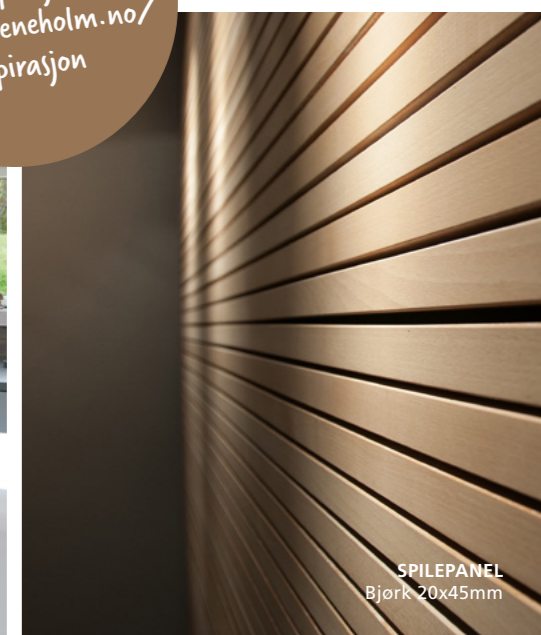
SPILEPANEL Bjørk 20x45mm