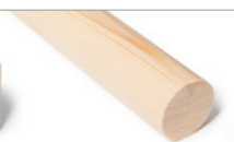
RUNDSTOKK Furu ubehandlet Fås i mange dim.