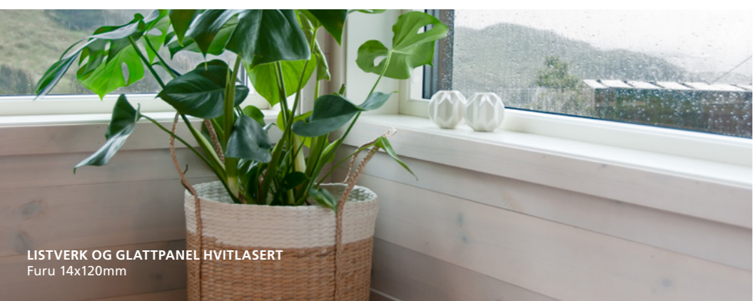
LISTVERK OG GLATTPANEL HVITLASERT Furu 14x120mm