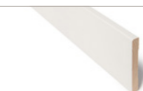
LISTVERK | ENKEL Furu / Finnes i flere dim.