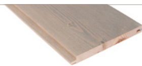
GLATTPANEL | DUSTY SILVER Furu / 14x145 mm Strukturbørstet med sølvskimmer