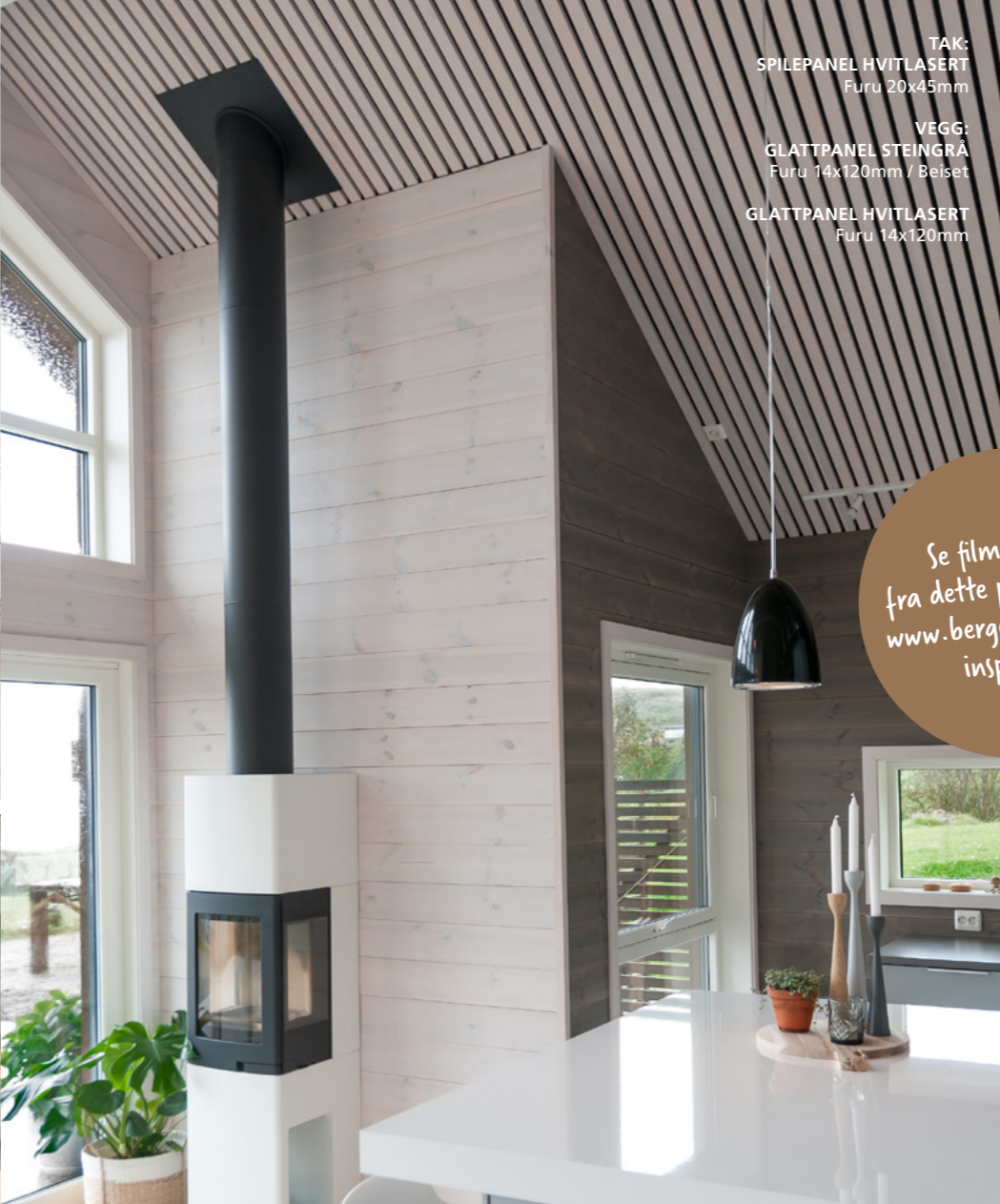
TAK: SPILEPANEL HVITLASERT Furu 20x45mm VEGG: GLATTPANEL STEINGRÅ Furu 14x120mm / Beiset GLATTPANEL HVITLASERT Furu 14x120mm

Se film og foto fra dette prosjektet på www.bergeneholm.no/ inspirasjon