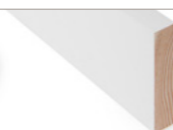
GLATTKANT Furu malt hvit Fås i mange dim.