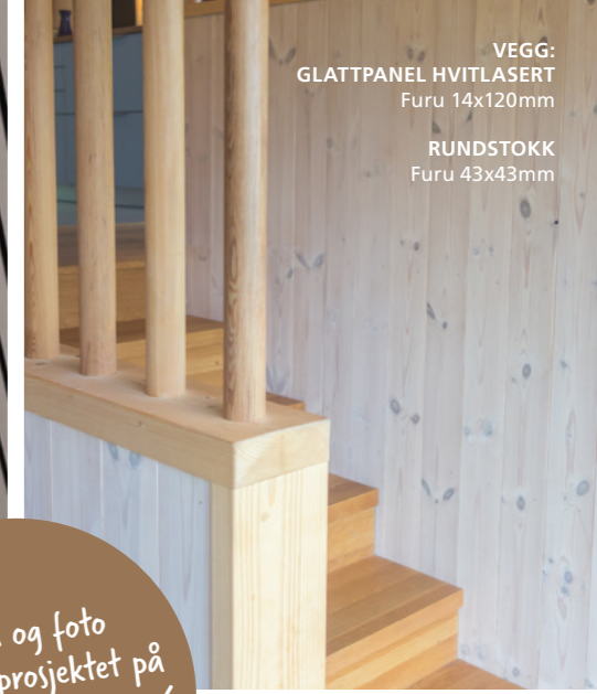
VEGG: GLATTPANEL HVITLASERT Furu 14x120mm RUNDSTOKK Furu 43x43mm

Se film og foto fra dette prosjektet på www.bergeneholm.no/ inspirasjon