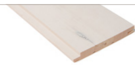
LÅVEPANEL | HVITLASERT Furu / 14x95/120 mm