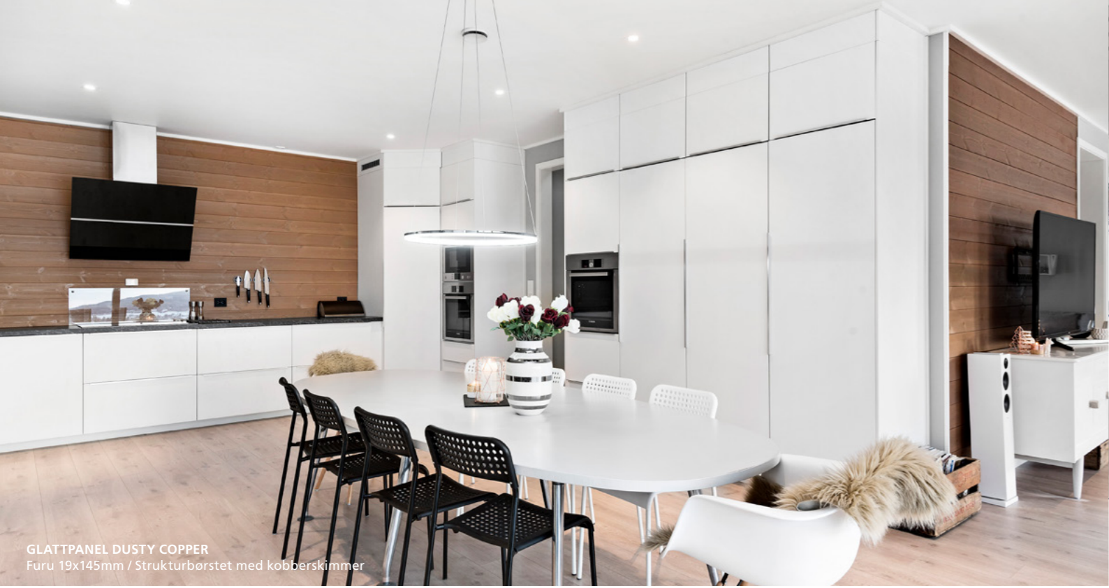
GLATTPANEL DUSTY COPPER Furu 19x145mm / Strukturbørstet med kobberskimmer