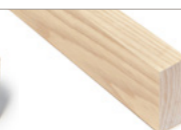
GLATTKANT RUND Eik hvitpigmenter 20x45 mm