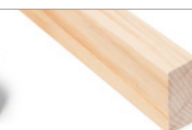
GLATTKANT RUND Ask ubehandlet 20x45 mm