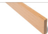
LISTVERK | ENKEL Eik 12x58 og 15x70 mm