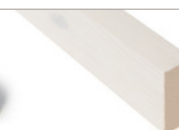
GLATTKANT RUND Furu hvitpigmenter 20x45 mm