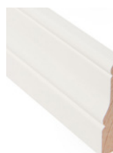
FOTLIST Dim. 15 x 70 mm

Listen ligner på sin populære halvbror, Antikk, men har en rund avslutning på toppen.