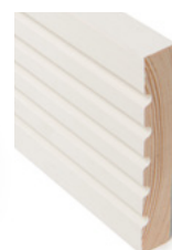
KARMLIST JUGEND Dim. 15 x 95 mm