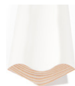
MÅKEVINGE 45° Dim. 15 x 45 mm