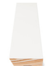
TAKLIST Dim. 12 x 44 x 4400