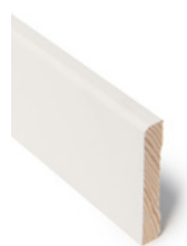
FOTLIST Dim. 10 x 58 mm

Listene finnes i flere dimensjoner, treslag og behandlinger.