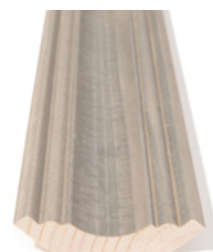
TAKLIST Dim. 16 x 70 mm