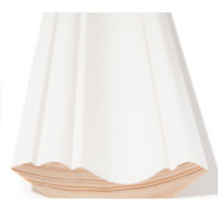
TAKLIST: Se side 15 Dim. 2 stk 15 x 70 + 21 x 95mm