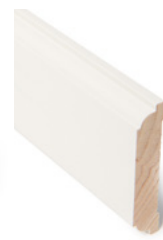
KARMLIST Dim. 15 x 70 mm