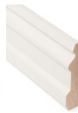
KARMLIST Dim. 15 x 70 mm