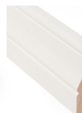
KARMLIST Dim. 15 x 70 mm