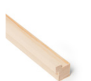
HJØRNELIST Dim. 23 x 23 mm