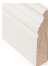
FOTLIST Dim. 21 x 95 mm

Karmlisten i denne serien er en kombilist, det betyr at du kan bruke listen både til fot- og karmlist. Kombilisten og taklisten kommer både i Bomull og Klassisk hvit.