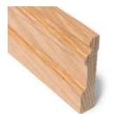
FOTLIST KLASSISK Dim. 15 x 70 mm