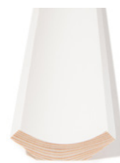
TAKLIST Dim. 21 x 58 mm