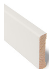
KARMLIST Dim. 12 x 58 mm