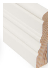
KARMLIST Dim. 21 x 95 mm