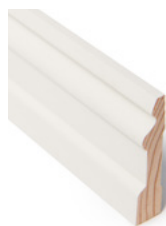
FOTLIST Dim. 15 x 70 mm

Listene finnes i flere dimensjoner, ulike treslag og behandlinger.