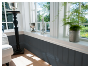
LISTVERK TIL ALT