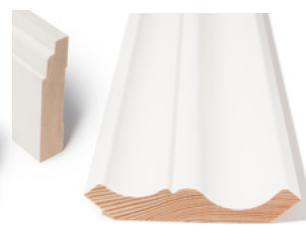
TAKLIST: 2 stk kombilist + antikk Dim. 2 stk 15 x 70 + 21 x 95mm