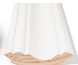
TAKLIST Dim. 21 x 95 mm