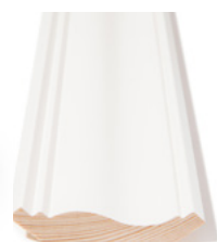
TAKLIST Dim. 15 x 70 mm