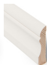
KARMLIST Dim. 15 x 70 mm