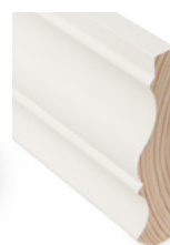
KARMLIST Dim. 21 x 95