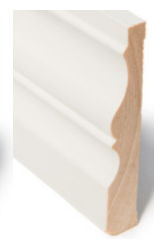
KARMLIST Dim. 21 x 120