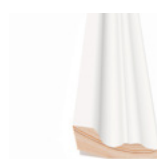
TAKLIST MED SKRÅ Dim. 28 x 58 mm

Listverk kan settes sammen for å oppnå ulike bredder og stil (se side 17). Noen lister kan brukes til å lage mønstre på vegg og dører (se side 18). Vær kreativ og bruk listverk på nye måter!