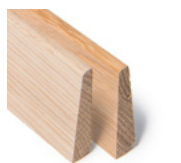
FOTLIST DISKRE Dim. 8 x 12 x 50 mm

Vi tilbyr også en del profiler i hvitpigmentert eik, tilpasset dagens gulvtrender. Selvsagt finnes det også tak- og karmolister i eik.