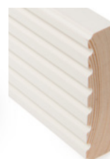
KARMLIST EMPIRE Dim. 21 x 95 mm