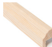
BRYSTLIST MED SPOR PROFILERT Dim. 21 x 34 mm