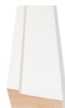
TAKLIST Dim. 21 x 45 mm