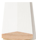
DIAMANT 15° Dim. 10 x 58 mm

Våre skråtak- og knevegglister finnes i fallende og faste 4400 mm lengder. Utvalget varierer innenfor hver profil.