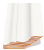
ANTIKK 45° SMAL Dim. 20 x 44 mm