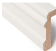
REHABILIST KLASSISK FALS 12 X 56 MM Dim. 26 x 67 mm