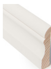
FOTLIST Dim. 15 x 70 mm

Taklisten finnes i to dimensjoner, både 15x58 og 16x70.