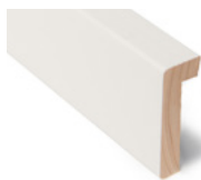
REHABILIST ENKEL FALS 12 X 47 MM Dim. 21 x 58 mm

Listen gir også en pen avslutning mot fliser, brannmur eller andre flater med høydeforskjell.