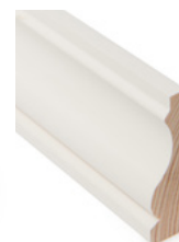
KARMLIST Dim. 18 x 70 mm