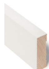
KARMLIST Dim. 17 x 56 x 4400