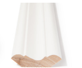
TAKLIST Dim. 21 x 65 mm