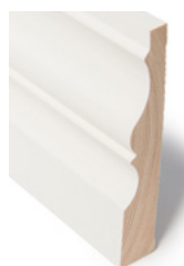
FOTLIST Dim. 21 x 120

Taklisten lages ved å sette sammen to til tre lister slik at den fremstår som en bred. Listene finnes i flere dimensjoner.