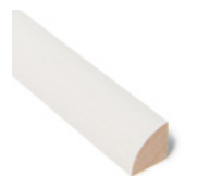
KVARTSTAFF Dim. 15 x 15 mm