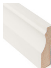
FOTLIST Dim. 18 x 70 mm

Vakker, enkelt profilert listverkserie som vil passe inn i de fleste rom og hus. Tidløs vil overleve trendsifter i flere generasjoner.