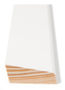
TAKLIST RUND Dim. 15 x 34 mm