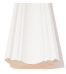
TAKLIST Dim. 16 x 70 mm