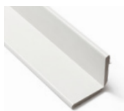
FLEXILIST 2700 MM Dim. 4 x 50/70 mm