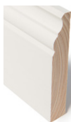
FOTLIST Dim. 21 x 120

Med bred fot- og karnlist, blir det ekstra flott å sette sammen en bred taklist, ref forslag.