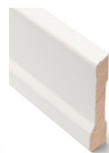
KARMLIST Dim. 15 x 70 mm