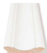
TAKLIST Dim. 16 x 70 mm