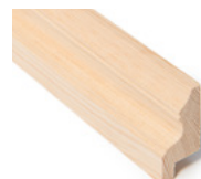
BRYSTLIST MED SPOR ANTIKK FALS 15X15MM Dim. 21 x 34 mm