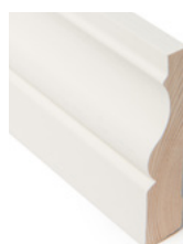
FOTLIST Dim. 21 x 95