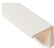
VINKELLIST Dim. 32 x 32 mm

Vi har en rekke ulike lister med ulike funksjon og egenskaper. Vinkel- og flexilisten beskytter og forskjøenner utsatte veggvinkler. Hjørnelisten gir en pen avslutning av panelte vegger inn mot rommets hjørner. Kwartstaff kan benyttes til så mangt, både til å skjule, avslutte og holde oppe og pyntelisten - ja, den pynter opp det meste.