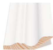
ANTIKK 45° BRED Dim. 28 x 58 mm