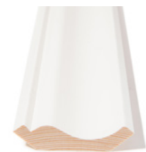
TAKLIST Dim. 18 x 70 mm