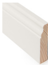
FOTLIST Dim. 15 x 70 mm

Både Idyll og Nostalgi har flere sammensatte profiler som gir interiøret en pen avrunding.