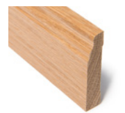
FOTLIST IDYLL Dim. 15 x 70 mm