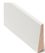
FOTLIST DISKRE Dim. 12 x 50 mm