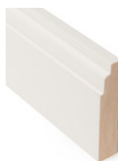
KOMBLIST Dim. 15 x 70 mm

Karmlisten har en søster som heter JUGEND. Denne har en litt flatere rilling.