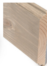
KARMLIST Dim. 15 x 95 mm