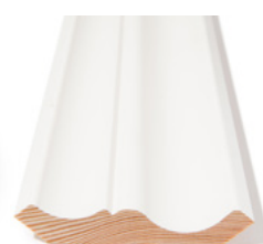
TAKLIST Dim. 21 x 95