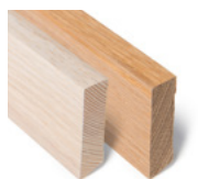
FOTLIST MODERNE Dim. 15 x 50 mm