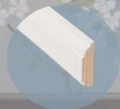
Brannmurlist Barokk 9 x 34

En av søkerene til Interiørprisen 2018 har virkelig sansen for flott listverk. Ved å sette sammen lister og glattkanter har vegg fått et skikkelig "løft". Med gulv og lister i samme farge, blir både gulv og vegg pent rammet inn.