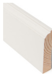
FOTLIST Dim. 15 x 70 mm

Listene finnes i flere dimensjoner og beiset i fargen Setergrå.