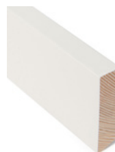
FOTLIST Dim. 15 x 56 x 4400

Den minner om en glattkant, men har blitt tilført listverks-egenskaper. Dimensjonen på fotlisten er tilpasset slik at overgangen mot karmlist blir pen mot dørkarm.