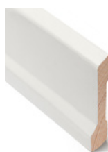
FOTLIST Dim. 15 x 70 mm

Den stramme profilen har en forsiktig "knekk" som er den lille ekstra detaljen som viser at her har brukeren gjort et bevisst valg.