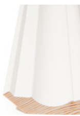
TAKLIST Dim. 20 x 70 mm