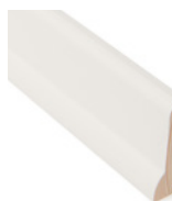
FOTLIST IDEAL Dim. 8 x 15 x 45 mm

Fullt sortiment finner du på våre nettsider.