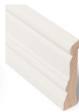
KARMLIST Dim. 15 x 70 mm