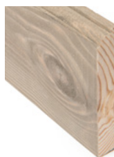
FOTLIST Dim. 15 x 95 mm

Listene er sortert ut i en egen kvalitet og beiset, slik at de harmonerer med panelene. Resultatet blir panel og list ton-i-ton.