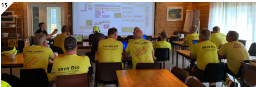
7. Avdeling Skarnes / Impregneringsanlegget er på plass