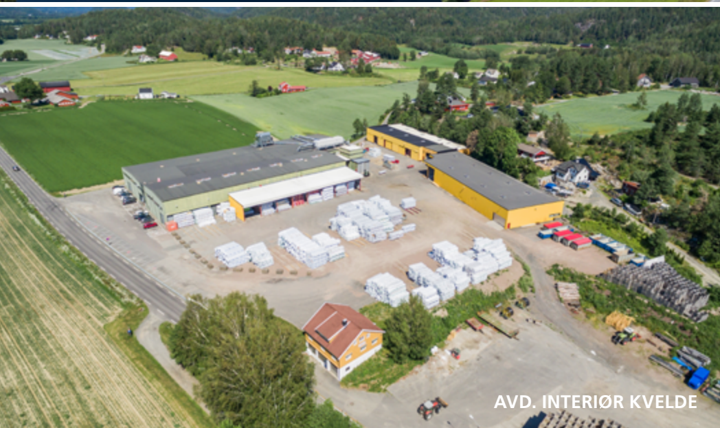
AVD. INTERIØR KVELDE