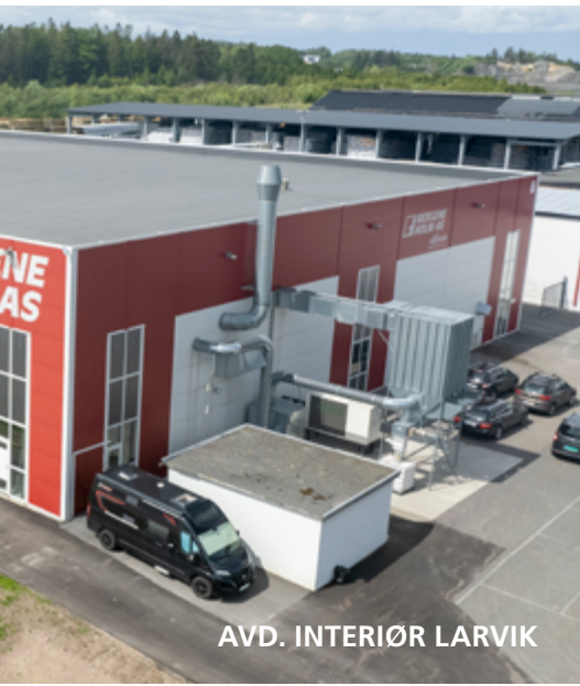
AVD. INTERIØR LARVIK